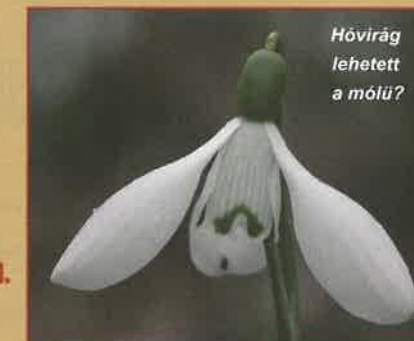
Hóvirág lehetett a móli?

Különböző kultúrkörökben a mitológia és a népi hitvilág számos növényt természetfeletti tulajdonságokkal ruház fel. Ezek háttérében a tudományos magyarázatok gyakran misztikummal keverednek.