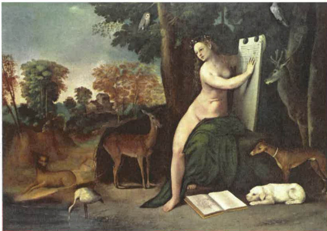
Kirké szeretőivel (Dosso Dossi, 1520)

K irké istennőnek különleges képessége volt a görög mitológia szerint: a férfiakat elcsábította, majd állatokká változtatta, és ezekkel a lényekkel élt a szigetén. Ezt tette Odüsszeusz embereivel is, akiket disznóvá változtatott. Odüsszeusz azonban Hermésztől kapott egy móli nek nevezett tejfehér színű virágot, amelynek segítségével