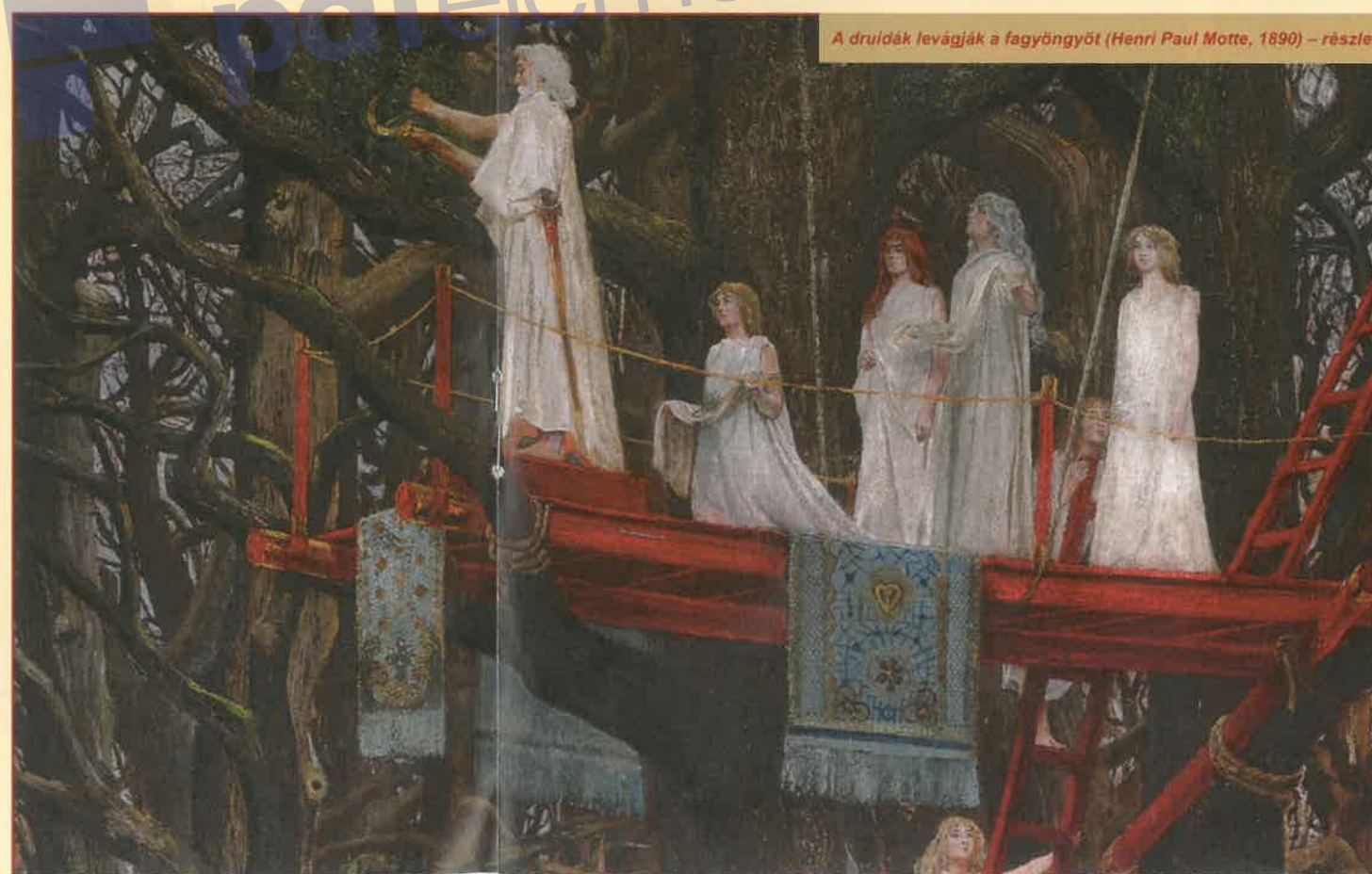
A druidák levágnák a fagyöngyöt (Henri Paul Motte, 1890) – részlet

A fagyöngyöt kizárólag aranyszálóval metszették le. Az arany az örök fény megszentelt szimbólumaként lehetővé tette, hogy a növény varázsereje a vágás után is megmaradjon. A fagyöngyből italt készítettek, és azt gondolták, hogy a meddő állatoknak meghozza a nemzőképességét, és minden méreg ellenszerként hat.