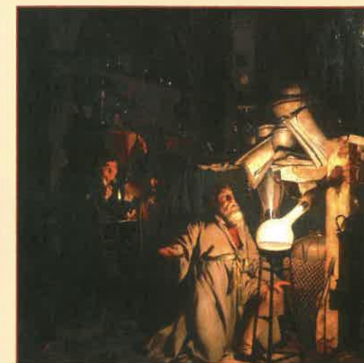
Az alkimista felfedezi a foszfort a bőlcsék kővének keresése közben (Joseph Wright of Derby, 1771)

közötti ingerületátvivő anyag, az acetilkolin hatását. Az ókor óta már számos tudós próbálta azonosítani a móli nevű növényt. Némelyek feltevézése szerint ez a hóvirág ( Galanthus nivalis ) lehetett, mert ráillik az alaktani leírás, és a benne lévő másodlagos metabolitok állítólag közömbösíteni tudják az antikolinerg mámor tüneteit.